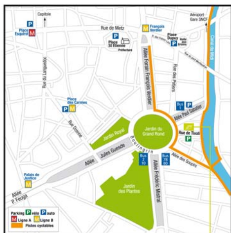
Maison de l'Environnement

Plus de 20 000 références documentaires pour toutes vos recherches dans les domaines de l'environnement, de l'énergie et du développement durable.